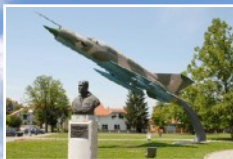
Spomen park Rudolfu Perešinu