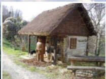
Rodna kuća Matije Gupca