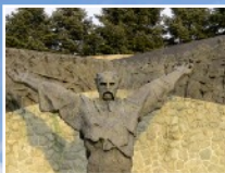
Spomenik Matiji Gupcu