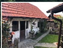
Etno selo Dišeća Starina